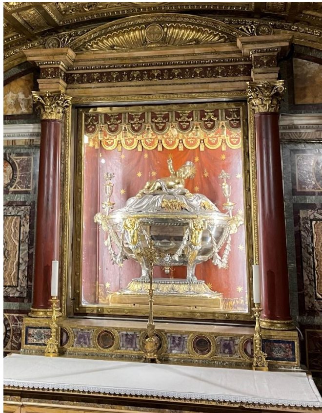
Päpstliche Basilika von Santa Maria Maggiore

Bischöfliches Jugendamt | Obermünsterplatz 10 | 93047 Regensburg